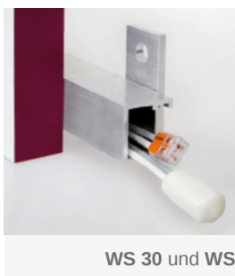
WS 30 und WS 40 Kabelschiene