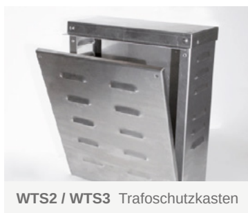
WTS2 / WTS3 Trafoschutzkasten