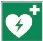
Art.-Nr./ Art. No 621.213.K Art.-Nr./ Art. No 621.213.F