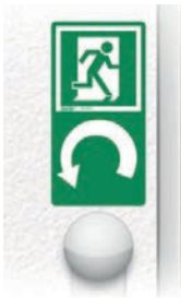
linksweisend: Art. -Nr. 622.003 pointing left: Art. No 622.003

Rotary handle mark self-adhesive foil, rounded corners, 100 x 250 mm