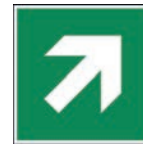
Art.-Nr./ Art. No 621.204.K Art.-Nr./ Art. No 621.204.F