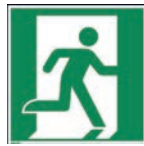
Art.-Nr./ Art. No 621.202.K Art.-Nr./ Art. No 621.202.F