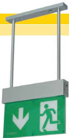
Rettungswegleuchte I Emergency escape route light I