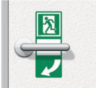
linksweisend: Art. -Nr. 622.001 pointing left: Art. No 622.001

Door handle mark backing self-adhesive foil, rounded corners, 100 x 250 mm