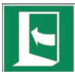
Art.-Nr./ Art. No 621.221.K Art.-Nr./ Art. No 621.221.F