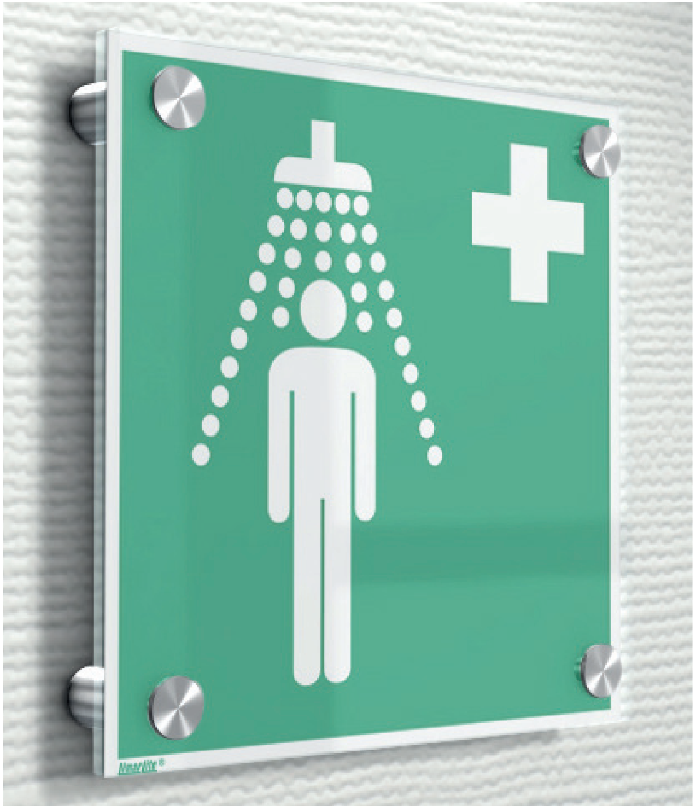
Produktbeispiel: PremiumFix Schild Product example: PremiumFix sign