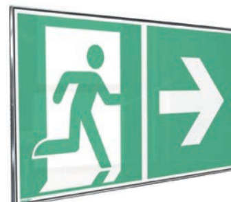
Produktbeispiel: ClickFix Schild Product example: ClickFix sign