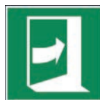
Art.-Nr./ Art. No 621.222.K Art.-Nr./ Art. No 621.222.F