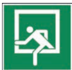
Art.-Nr./ Art. No 621.217.K Art.-Nr./ Art. No 621.217.F