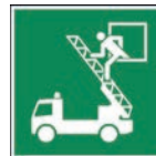
Art.-Nr./ Art. No 621.215.K Art.-Nr./ Art. No 621.215.F