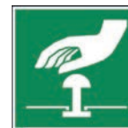
Art.-Nr./ Art. No 621.220.K Art.-Nr./ Art. No 621.220.F