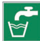
Art.-Nr./ Art. No 621.219.K Art.-Nr./ Art. No 621.219.F