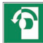
Art.-Nr./ Art. No 621.223.K Art.-Nr./ Art. No 621.223.F