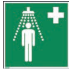
Art.-Nr./ Art. No 621.206.K Art.-Nr./ Art. No 621.206.F