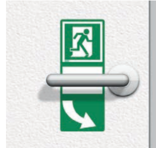
rechtsweisend: Art. -Nr. 622.002 pointing right: Art. No 622.002

Drehgriffmarkierung selbstklebende Folie, abgerundete Ecken, 100 x 250 mm