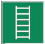
Art.-Nr./ Art. No 621.209.K Art.-Nr./ Art. No 621.209.F