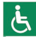
Art.-Nr./ Art. No 621.211.K Art.-Nr./ Art. No 621.211.F