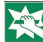
Art.-Nr./ Art. No 621.216.K Art.-Nr./ Art. No 621.216.F