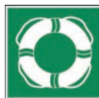
Art.-Nr./ Art. No 621.218.K Art.-Nr./ Art. No 621.218.F