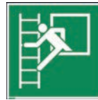
Art.-Nr./ Art. No 621.207.K Art.-Nr./ Art. No 621.207.F