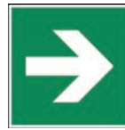
Art.-Nr./ Art. No 621.203.K Art.-Nr./ Art. No 621.203.F