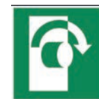
Art.-Nr./ Art. No 621.224.K Art.-Nr./ Art. No 621.224.F