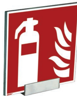
Produktbeispiel: PremiumFix Schild mit Con-Fix 6 Schildklemme Product example: PremiumFix sign with Con-Fix 6 sign clamp