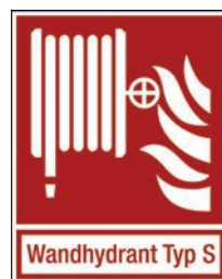
Abbildung links: Art.-Nr./ Art. No 625.230.K Art.-Nr./ Art. No 625.230.F Format 200 x 250 mm