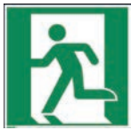
Art.-Nr./ Art. No 621.201.K Art.-Nr./ Art. No 621.201.F

The square shaped one-sided rescue signs of 150x150 mm are made of plastic (art.-no. .K) or thin foil (art.-no. .F), both photoluminescent. Other materials, sizes and pictograms are available on request.