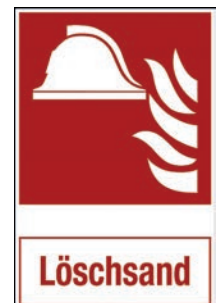
Abbildung links: Art.-Nr./ Art. No 625.232.K Art.-Nr./ Art. No 625.232.F Format 200 x 250 mm