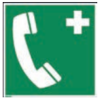
Art.-Nr./ Art. No 621.205.K Art.-Nr./ Art. No 621.205.F