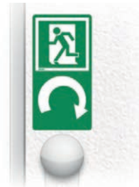
rechtsweisend: Art. -Nr. 622.004 pointing right: Art. No 622.004