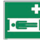
Art.-Nr./ Art. No 621.208.K Art.-Nr./ Art. No 621.208.F