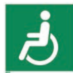
Art.-Nr./ Art. No 621.210.K Art.-Nr./ Art. No 621.210.F