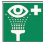
Art.-Nr./ Art. No 621.214.K Art.-Nr./ Art. No 621.214.F