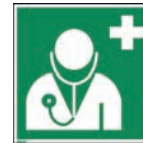
Art.-Nr./ Art. No 621.212.K Art.-Nr./ Art. No 621.212.F